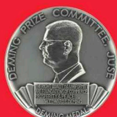
DEMING PRIZE 2003